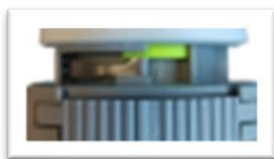
First-Open enclenché Commande thermique hors tension Vanne ouverte