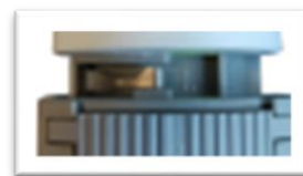
First-Open déclenché Commande thermique sous tension Vanne ouverte