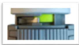
First-Open déclenché Commande thermique hors tension vanne fermée